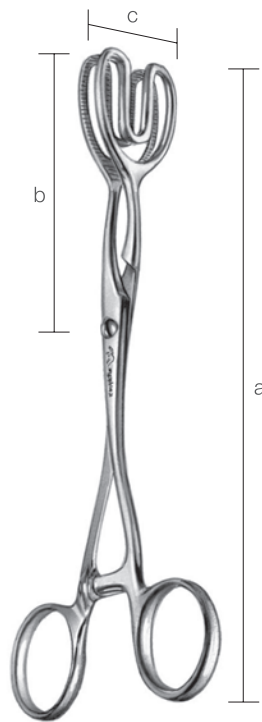
10300900 舌鉗子 ポッチ氏 a 170 b 75 c 25