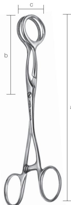
10301000 舌鉗子 コラン氏 a 170 b 75 c 28