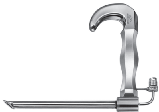
10401000 上部食道鏡 小野氏 小児用 a 130