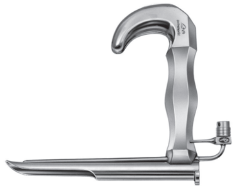
10400500 喉頭直達鏡 ジャクソン氏 小児用 a 110