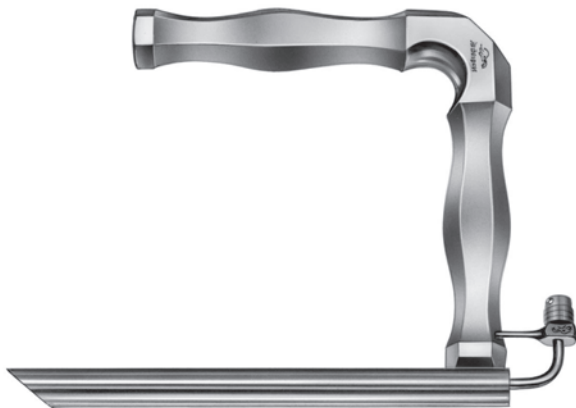
10400600 喉頭直達鏡 ジャクソン氏 前連合用 a 147