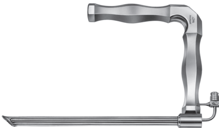
10400900 上部食道鏡 小野氏 成人用 a 190