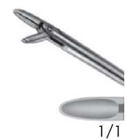
10313803 左開 a 215 b 95