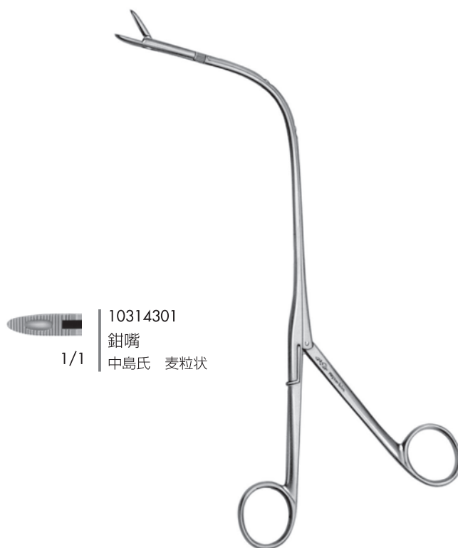
10314301 鉗嘴 中島氏 麦粒状 1/1