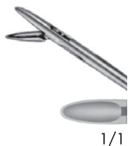
10313802 下開 (後) a 215 b 95