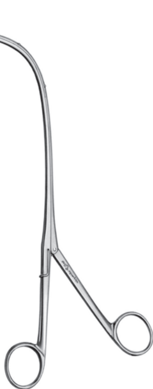
10313700 先端回転式 (鉗嘴 鋭匙状付) a 215 b 100