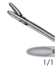
10313801 上開 (前) a 215 b 95