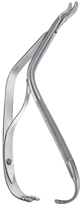
10308800 口蓋縫合用持針器 切替氏 a 190 b 35