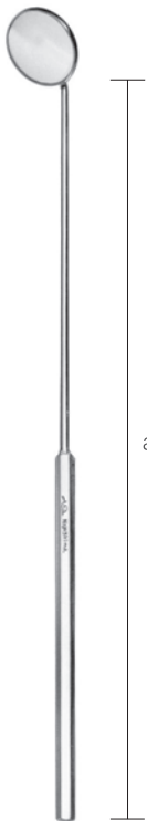
10311601~8 喉頭鏡 柄固定式 柏原氏 a 185