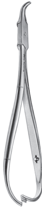
10308700 口蓋縫合用持針器 山崎氏 a 185 b 45