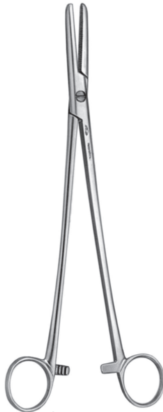
10302800 扁桃止血鉗子 西端氏 a 205 b 48