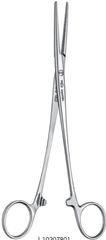
10307801 扁桃止血鉗子 ベック氏直 a 185 b 55