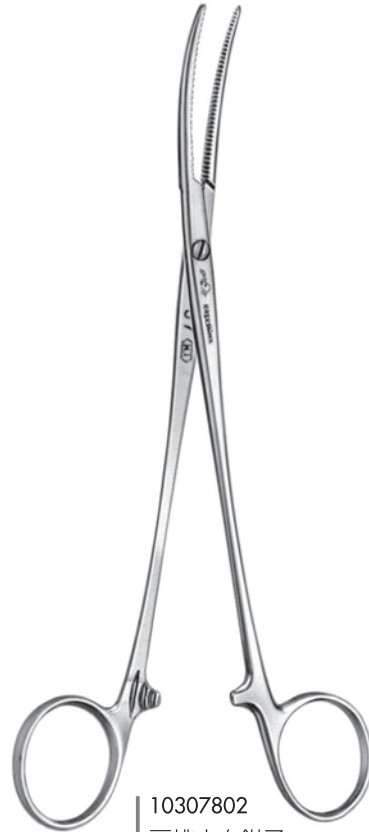
10307802 扁桃止血鉗子 ベック氏弯 a 185 b 55