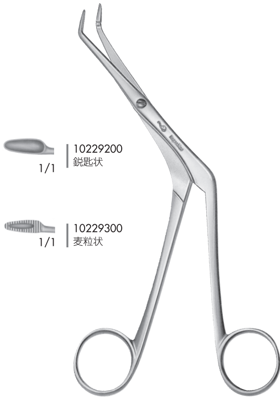
篩骨用上向鉗子 柏原氏 a 172 b 50