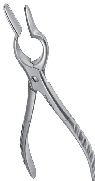
10218802 鼻骨整復鉗子 ワルシャム氏 右 全長 200