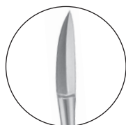
10223800 対孔粘膜刀 細谷氏 全長 167 a 15