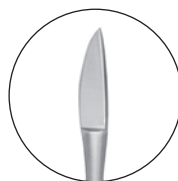
10218900 長柄粘膜刀 西端氏 全長 202 a 15