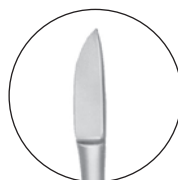
10223900 対孔粘膜刀 久保氏 全長 152 a 17