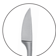
10223400 対孔粘膜刀 京大型 全長 166 a 15