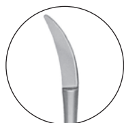
10223700 対孔粘膜刀 丸山氏 全長 165 a 15