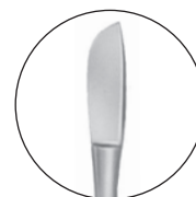
10219000 粘膜刀 ハーレー氏 全長 125 a 15