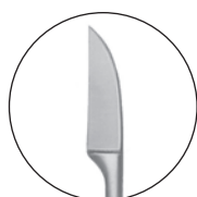
10223500 対孔粘膜刀 増田氏 全長 166 a 15