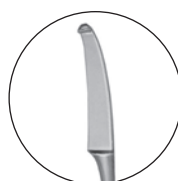
10223600 対孔粘膜刀 高木氏 全長 166 a 17