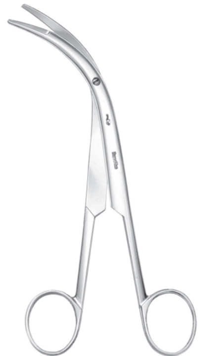
10206600 中甲介剪刀 ベックマン氏 a 158 b 50