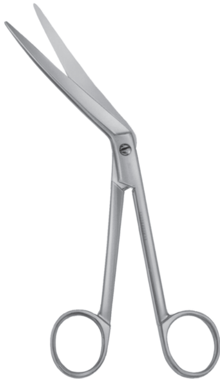
10206400 下甲介剪刀 菊地氏 a 163 b 74