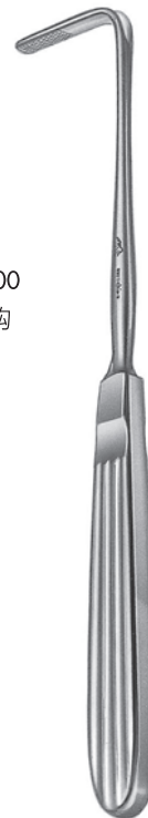
10126700 外耳道鉤 久保氏 全長190