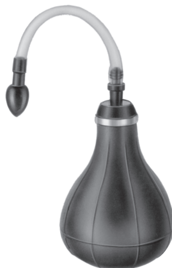
10114200 送気ゴム球 千葉氏