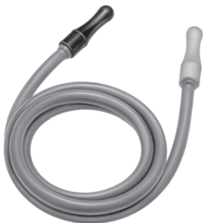
10114300 オトスコープ ゴム管全長 90cm (シリコン製)