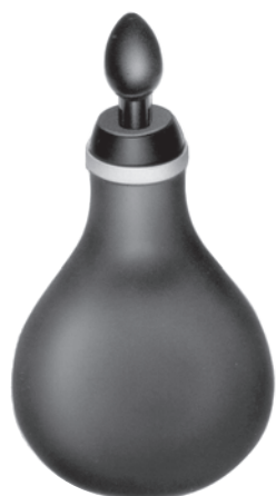
10113600 送気ゴム球 ポリツェル氏