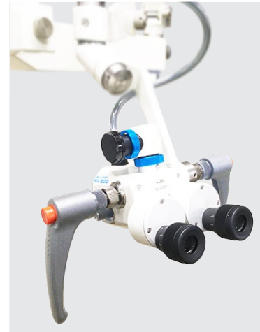
手術用双眼顕微鏡 SN-200 を支柱に取付けることもできます (別売)